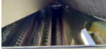
Blick ins Hebewerk mit Archimedesschraube

Die ARA in Sissach reinigt das Abwasser von rund 30'000 Einwohner:innen. Eine gute Reinigungsleistung ist essentiell für das Gewässer Ergolz.